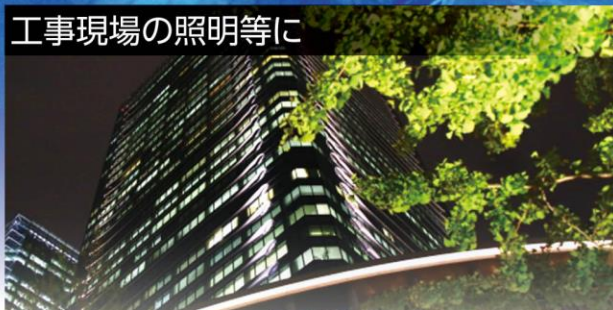
工事現場の照明等に